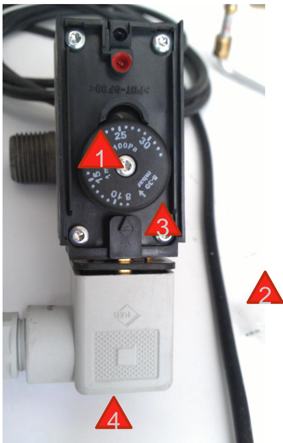
Реле минимального давления газа