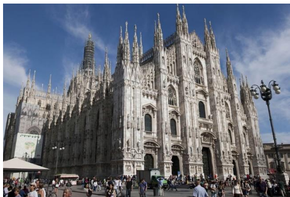
Миланский собор

Также различают английскую готику, в которой очень широкий главный фасад, украшенный декорированными ярусами, усложненный план здания (центрические залы, различные коридоры и трансепты) и множество высоких башен.