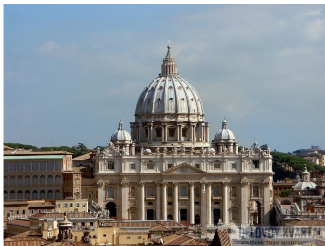
Собор Святого Петра

В XV веке появился Ранний Ренессанс, в XVI веке Высокий и Поздний. На территории Италии во времена между средневековьем и новым временем зародилось новое архитектурное течение, в котором в качестве идеала рассматривались традиции Древнего Рима. Со временем Ренессанс распространился по территории всей Европы. Вместе с интересом к античности