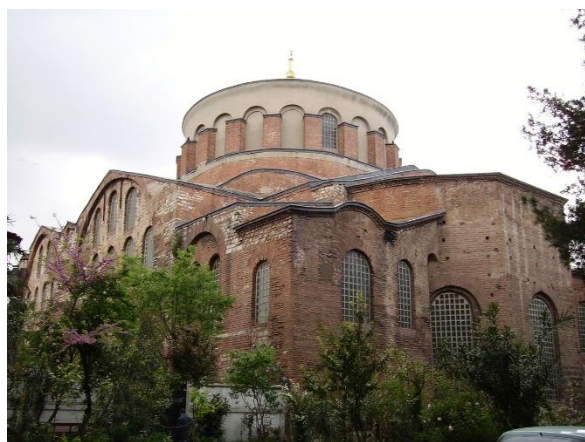
Церковь Святой Ирины в Константинополе; фото ru.wikipedia.org

Приход средневековья ассоциируется с византийской архитектурой, которая пришла в VI веке и продолжала свое развитие вплоть до первой