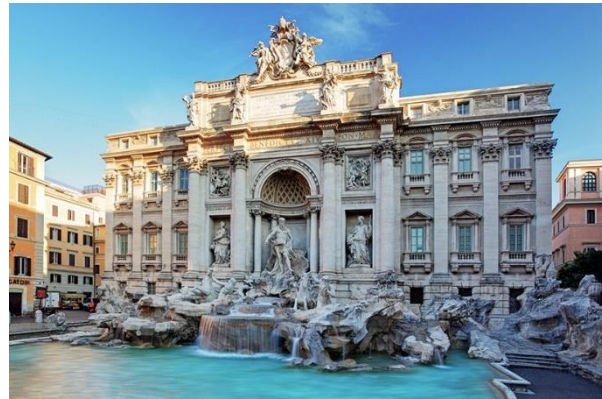
Фонтан Треви

Приход Нового времени открывает стиль барокко, который является противоположностью Ренессансу. Это течение бунтует против рационализма, стараясь всеми силами создать ощущение богатства, величия и могущества с помощью сложных пространственных эффектов и пышного скульптурного декора. В барокко много колоннад, скульптурных композиций, кариатид, многоярусных куполов.