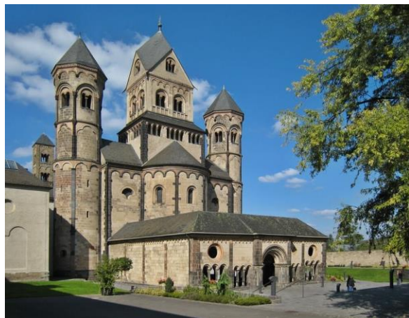
аббатство Мария Лаах

Затем последовал Оттоновский период, который предшествовал появлению романской архитектуры в 951-1024 гг. Появился в Германии во время правления Отто Великого под влиянием византийской эпохи и Каролингской. Во всем стиле наблюдается некая математичность построек, выражающаяся в гармонии деталей построений. Помимо четко выверенных форм присутствуют популярные детали византийского течения – колонны, круглые арки, плоские потолки.