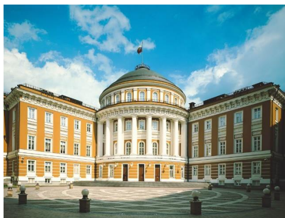
Сенатский дворец

В XVII – начале XIX века появляется классицизм, в философии которого лежало пришедшее из Ренессанса стремление подражания античному идеалу. В те времена вернулся в моду рационализм, благодаря множеству научных открытий. С приходом во Францию абсолютизма началась пропаганда регулярности и порядка, которая прослеживалась в архитектуре. Таким образом, в классицизме главными отличительными чертами являются: