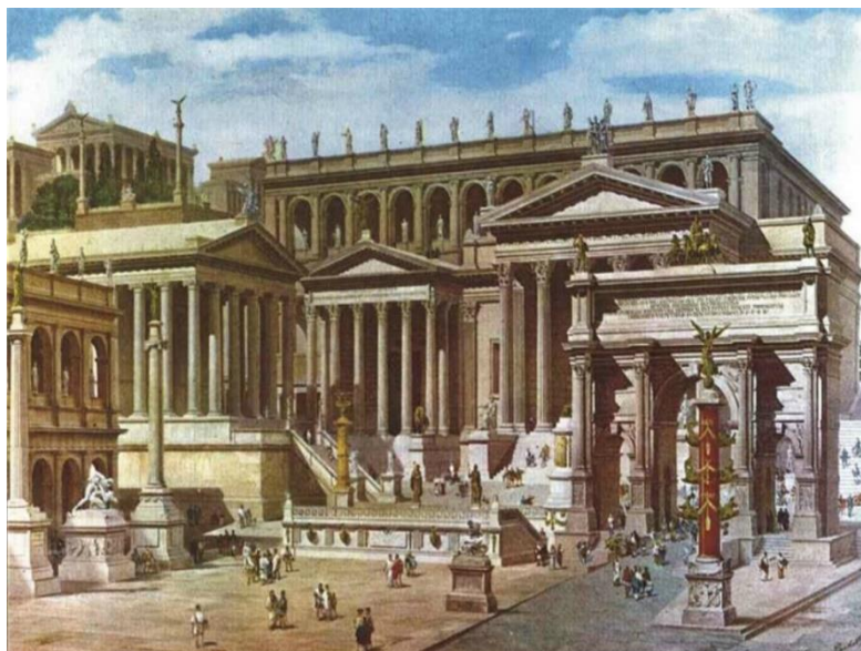
Архитектура Древнего Рима

Триумфальная арка и прочие сооружения, поражающие своим величием. Стилистика при этом стала более минималистичной, строгой и простой.