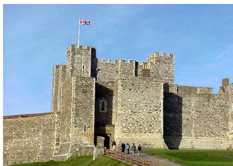
Дуврская крепость; фото smallbay.ru

Каролингский стиль пришел на смену Меровингскому в 780 – 900 гг. Германский король Карл Великий восхищался Римской Империей и хотел, чтобы его собственная империя была такой же великой. Эти стремления отразились в архитектуре – в Каролингском стиле соединяются римская архитектура, византийская и европейская.