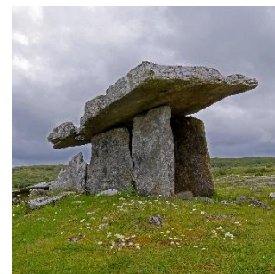
Пример первых древнейших построек; фото pixabay.com

Началом зарождения архитектуры можно считать момент, когда люди научились делать первые каменные и деревянные конструкции. Сама система строений не сильно изменилась – в древности огромные плоские камни складывались друг на друга, выстраивая своеобразный куб. Такая же схема используется и в нынешнее время, но уже с более удобными и практичными огромными бетонными блоками.