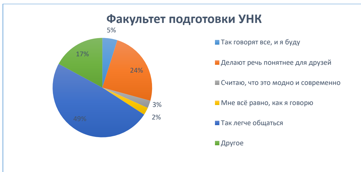
Рис. 3 Ответы опрашиваемых лиц факультета подготовки учителей начальных классов (УНК) на 2 экспериментальный вопрос

По результатам 2 экспериментального вопроса можно сделать вывод о том, что студенты исторического факультета (49%) и факультета подготовки учителей начальных классов (46%) употребляют нелитературную речь в большей степени по причине «Так легче общаться». Стоит отметить, что у студентов существует большая потребность в упрощении произношения длинных слов для быстрого обмена информацией и для встречного понимания.