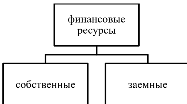
Рисунок 1. Классификация финансовых ресурсов по титулу собственности

Функция контроля основывается на регулировании финансовой деятельности фирмы. С ее помощью определяется уровень рентабельности и результативность деятельности предприятия. Наряду с функцией контроля стоит такое понятие как "контроль рублем". Он имеет способность к воздействию на эффективность предпринимательской деятельности, в частности на: качество и количество трудовых ресурсов, эффективность использования оборотных и необоротных фондов и т.д. С помощью «контроля рубля 2 » регулируются отношения с контрагентами и соблюдение всех обязательств по договорам. Основными инструментами контроля являются показатели финансовой отчетности и экономических рычагов (налогообложение, выдача субсидий и др.) (рис. 1)