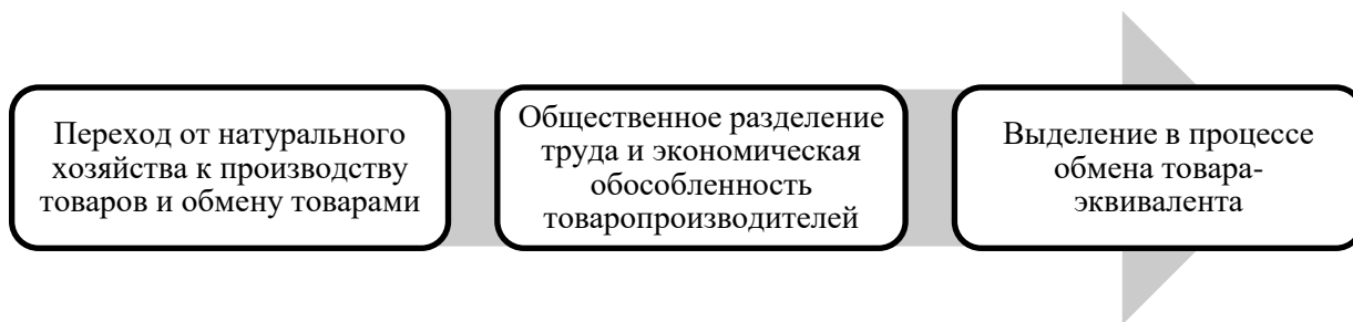
Схема 2. Причины перехода к товарно-денежному обмену.

На данном этапе можно выделить основные причины перехода к товарно-денежному обмену, которые обусловлены ходом истории и развитием товарных отношений: