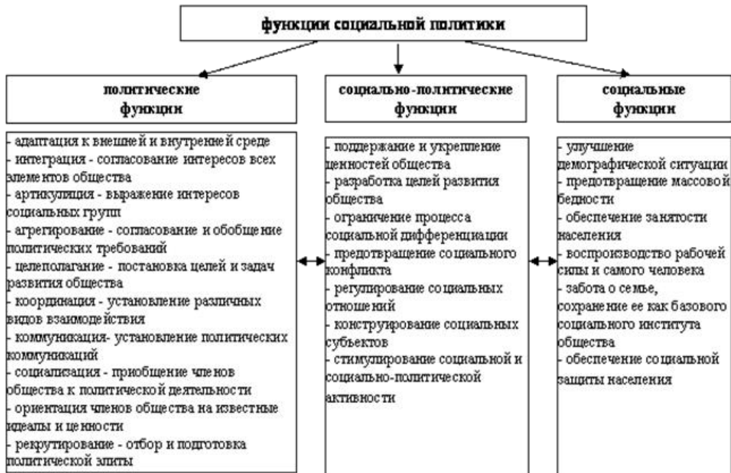
Рисунок 1. – Функции социальной политики

Основные направления социальной политики России представлены на рисунке 2.