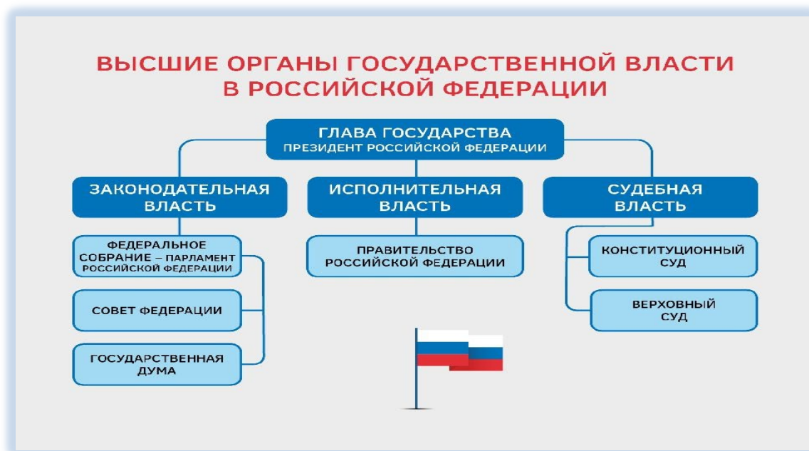
Рисунок 1. Высшие органы государственной власти в РФ