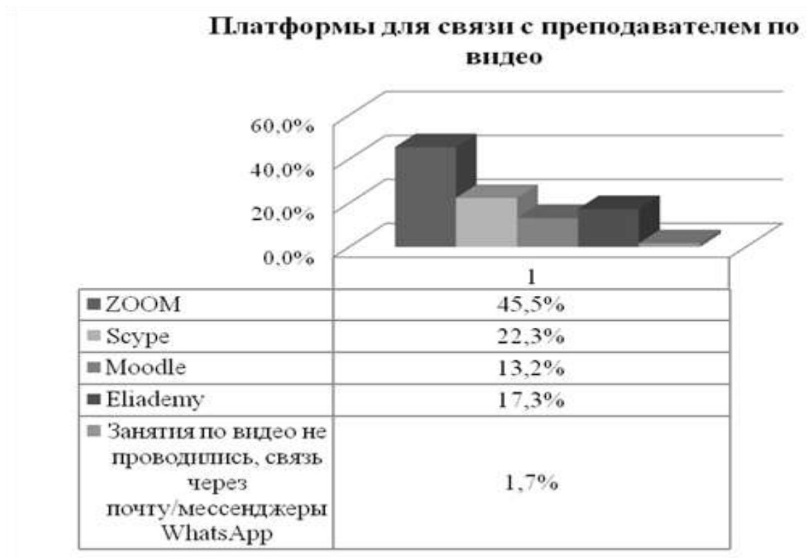
Рис.1 Платформа для связи с преподавателем по видео

К основным преимуществам дистанционного обучения английскому языку в том числе и в Донском ГАУ можно отнести: