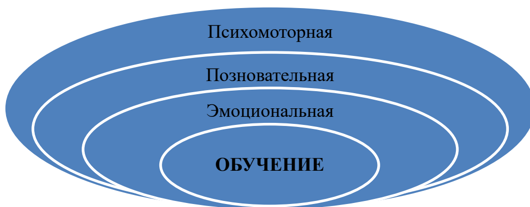
Рисунок – 1. Сферы обучения