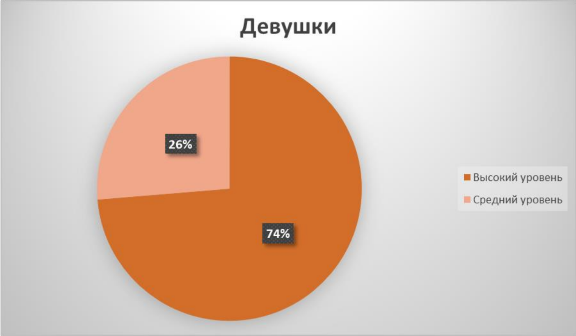
Рисунок 1 Способность к любви (Девушки)