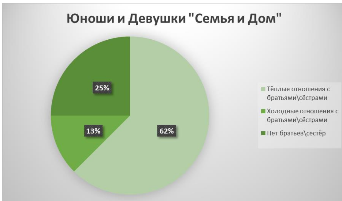
Рисунок 8 Семья и Дом (Общая)

По-видимому, это единственные дети в семьях. Особое внимание мы обратили на ответы ребят под номерами 6 и 7. Многие написали, что любят свою семью, сопровождая ответ небольшими комментариями, например, некоторые добавили, что не хотели бы в будущем иметь семью, похожую на ту, в которой они сейчас живут. Из этого мы можем сделать вывод о том, что в семьях данных молодых людей присутствуют негативные моменты и они постараются избежать их, когда начнут строить свои семьи.