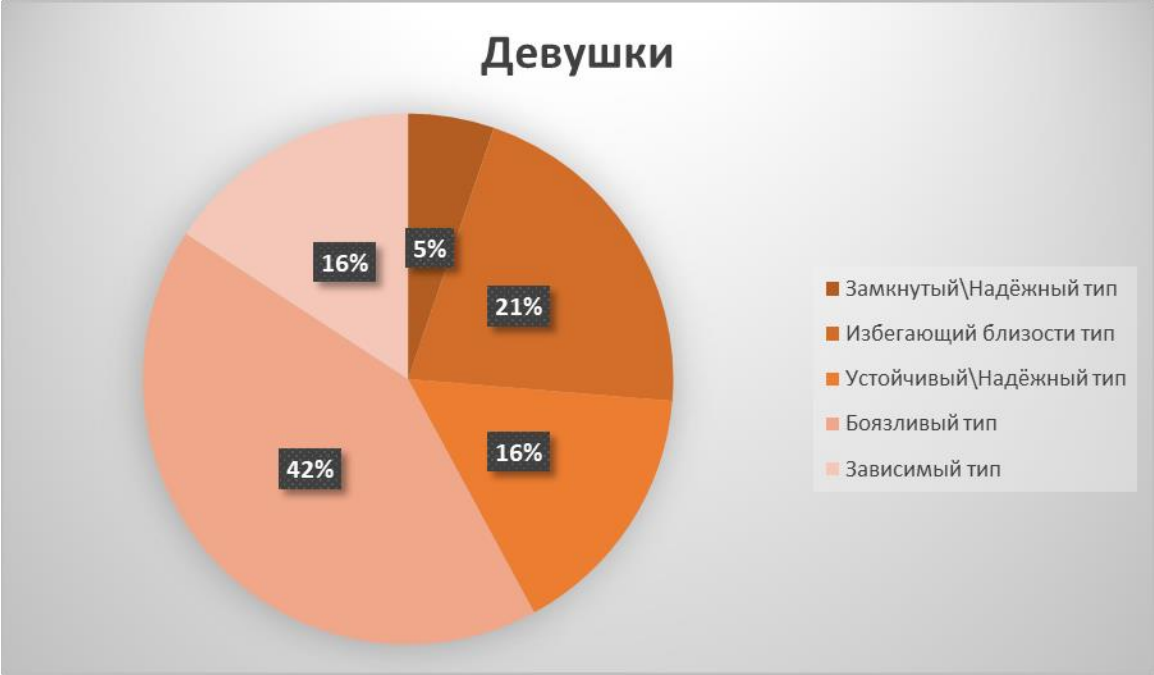
Рисунок 4 Опыт близких отношений (Девушки)