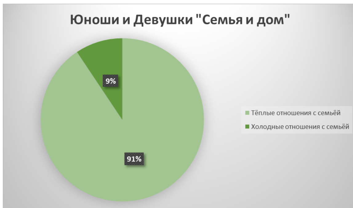
Рисунок 7 Семья и дом (Общая)

На четвёртом этапе исследования нами был проведён опрос о том, насколько комфортно чувствуют себя юноши и девушки в отношениях с родителями (Рис. 7, 8, 9) и братьями/сёстрами (Рис. 10, 11, 12). Данные нашего опроса (авторский опросник «Семья и дом») показали, что большая часть (91%) имеет тёплые отношения в семье, оставшая же часть (9%) имеет холодные отношения.