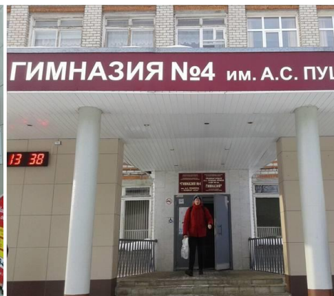
Гимназия имени А.С.Пушкина