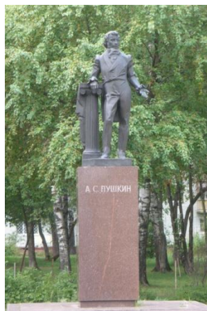
Сквер и памятник А.С.Пушкину