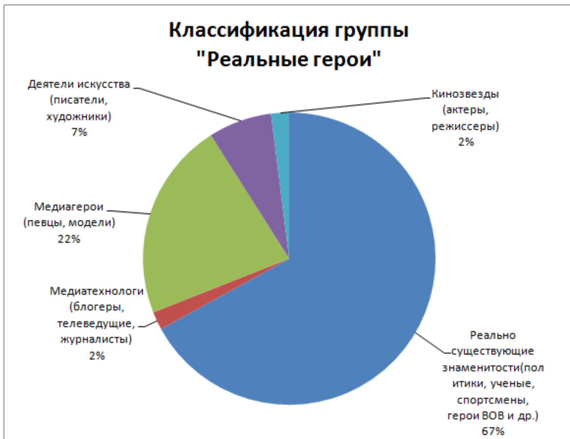
Рис. 2. Классификация группы "Реальные герои"

Наибольшее количество ответов набрала подгруппа «Реально существующие знаменитости» (67%). В ответах данной категории подростки, чаще всего, указывали политических деятелей (44%) – В.В. Путина, В.В. Жириновского, С. В. Лаврова; ученых, изобретателей (33%) - Стивена Хокинга, Илона Маска. Подгруппа «Медиагерои» составила 22% , в нее вошли такие известные личности как В. Цой, В. Высоцкий, рок-группа Сплин. Немногочисленными оказались подгруппы «Деятели искусства» - 7%, «Медиатеchnологи» - 2% и «Кинозвезды» - 2%.