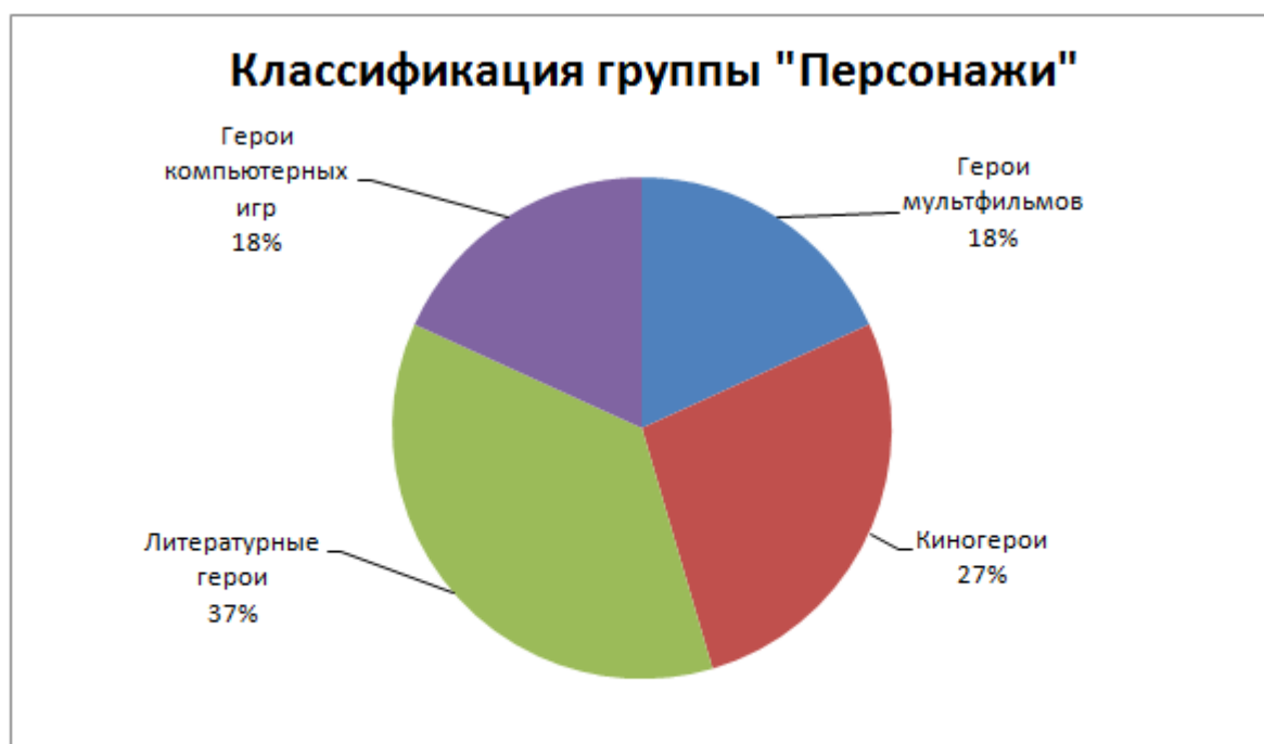
Рис 3. Классификация группы "Персонажи"

Из диаграмм мы видим, что любимыми героями старших подростков становятся реальные герои - реальные люди. Фаворитами подрастающего поколения, образцами поведения оказываются политические деятели и ученые – изобретатели.