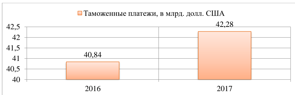
Рис. 2 Динамика поступлений денежных средств от деятельности Домодедовской таможни в бюджет РФ за 2016-2017 гг.

Динамика поступлений денежных средств от деятельности Домодедовской таможни в бюджет РФ за 2016-2017 гг. представлена на рис. 2