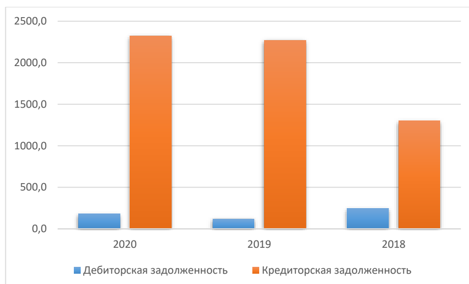
Рис. 2. Уровень дебиторской и кредиторской задолженности ОАО ТД «Изумруд» за 2018-2020 гг. в тыс. ед.

руб. По состоянию на 31 декабря 2020 года дебиторская задолженность ОАО ТД «Изумруд» составила 182 тыс. руб., что на 67 тыс. руб. больше по сравнению с прошлым годом. Подлежащих к уплате штрафных санкций перед бюджетом по состоянию на 31.12.2020 нет. Однако уровня дебиторской задолженности значительно не хватает для покрытия кредиторской задолженности (Рис.2), таким образом, можно судить о вероятных проблемах с реализацией товаров.