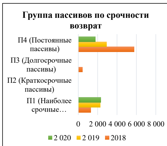
Рис. 3. Динамика ликвидности ОАО ТД «Изумруд» за 2018 – 2020 гг.

Из рисунка 3 видно, что финансирование текущих обязательств возможно с помощью медленно реализуемых активов (запасов).