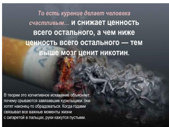
Рисунок 3. Финал. Ценности.

На общей рефлексии 100 % учеников сказали, что вся информация была для них новой, многие совершенно не знали о том, как никотин влияет на наш организм. В конце занятия нами обсуждалась манипуляция. Что это такое, какое к ней отношение и прочее. Дополнительно учащимся предлагалось подумать над следующим вопросом: «Так если каждый из вас к манипуляции относится плохо, почему же вы позволяете манипулировать своим же организмом?»