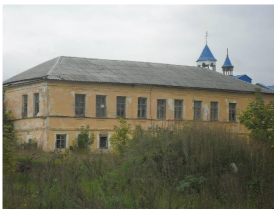
Рисунок 1. Усадьба графини А.В. Ластовской

ветхом состоянии и нуждается в реставрации, являясь объектом культурного наследия. Но, к сожалению, дом графини Ластовской владельцы не хотят реставрировать. Вопрос о ремонте давно открыт, но никаких действий не совершается.