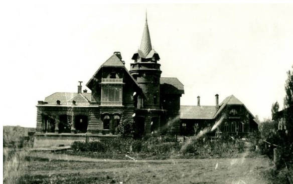
Рисунок 4. Усадьба дворян Мухановых. Архивное фото. 1910г.