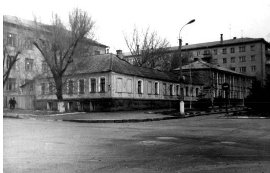
Рисунок 2. Общий вид усадьбы курб. Архивное фото, 90е годы

наследия. Сейчас на этом месте стоит деловой офисный центр АО «Белгородэнергосбыт», в архитектуре которого элементы усадьбы купчихи Курбатовой, а именно уличные фасады, включены в структуру фасадов современного здания.