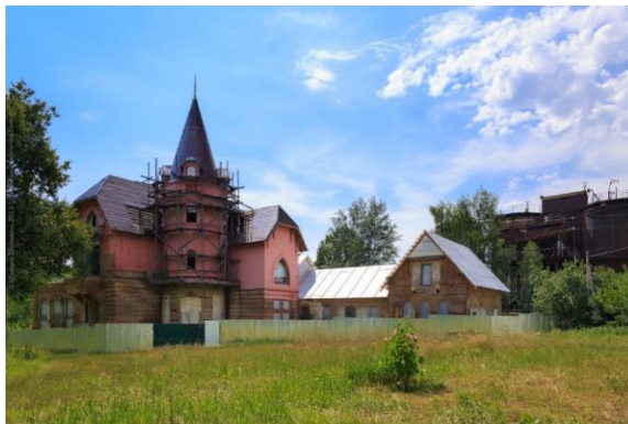
Рисунок 5. Реставрационные работы. Фото 2018 г.