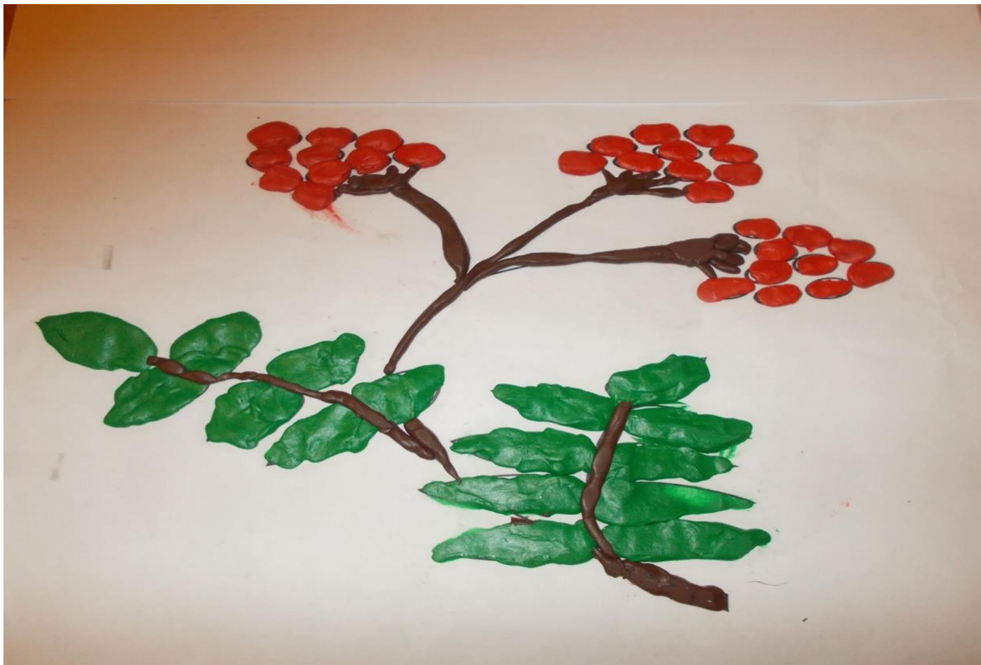
Сюжетная картинка «Рябинка» выполнена в технике платинографии Данил Б. 5 лет