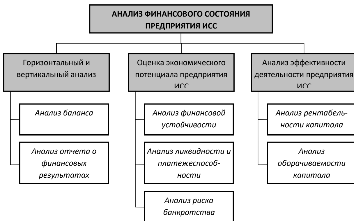
Рис. 2. Основные блоки анализа финансового состояния предприятия ИСС

Таким образом, в ходе анализа финансового состояния предприятия инженерно-строительной сферы оцениваются экономический потенциал и финансовые результаты деятельности экономического субъекта, а также многочисленные показатели, отражающие соотношение результатов деятельности предприятия и ресурсов, затраченных на её осуществление.