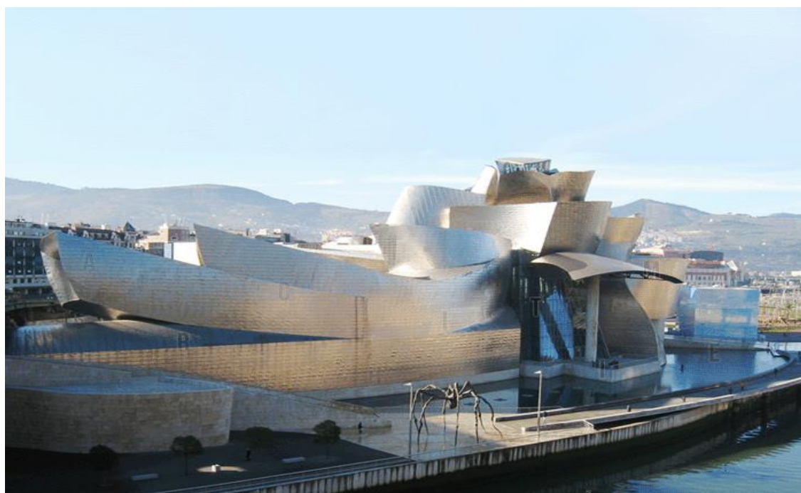
Рисунок 5- Музей Гуггенхайма, Бильбао, Испания, 1997 г.

У Гери взгляд на архитектуру свободный от классических и рационалистских шаблонов. Его проекты неформальные и остроумные. Экспрессивные формы, неординарные материалы, "сломанные" архитектурные элементы - визитная карточка архитектора. Гери является автором самых известных проектов в стиле деконструктивизма — музея Гуггенхайма в Бильбао, концертного зала им. Уолта Диснея в Лос-Анджелесе, "Танцующего дома" в Праге и многих других.