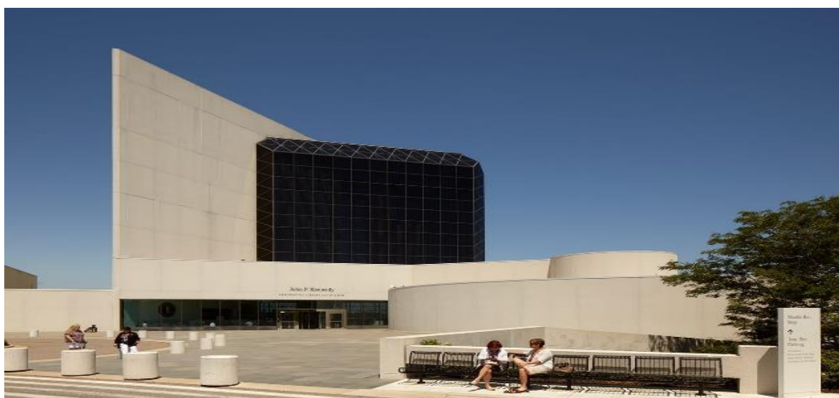
Рисунок 3-Библиотека им. Джона Ф. Кеннеди ,Бостон, США, 1979

Библиотека им. Джона Ф. Кеннеди. Построенное в память о президенте Джоне Ф. Кеннеди здание библиотеки состоит из единственной треугольной башни, выступающей из расширяющегося основания, сложенного из геометрических форм. Центр архитектурной композиции — куб из стекла, из которого открывается потрясающий вид на Массачусетский залив.