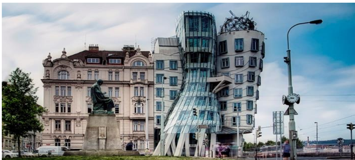
Рисунок 7- Танцующий дом (Комплекс Джинджер и Фред), Прага, Чехия, 1996 г.

Фрэнк не отказывался от малобюджетных заказов. Для него это был вызов - интуиции и воображению. Он проектировал дом Вагнер из б/у материалов, дом Нортона из дерева и металла, калифорнийский музей авиации. Для отделки интерьера правительство штата не предусмотрело средств.