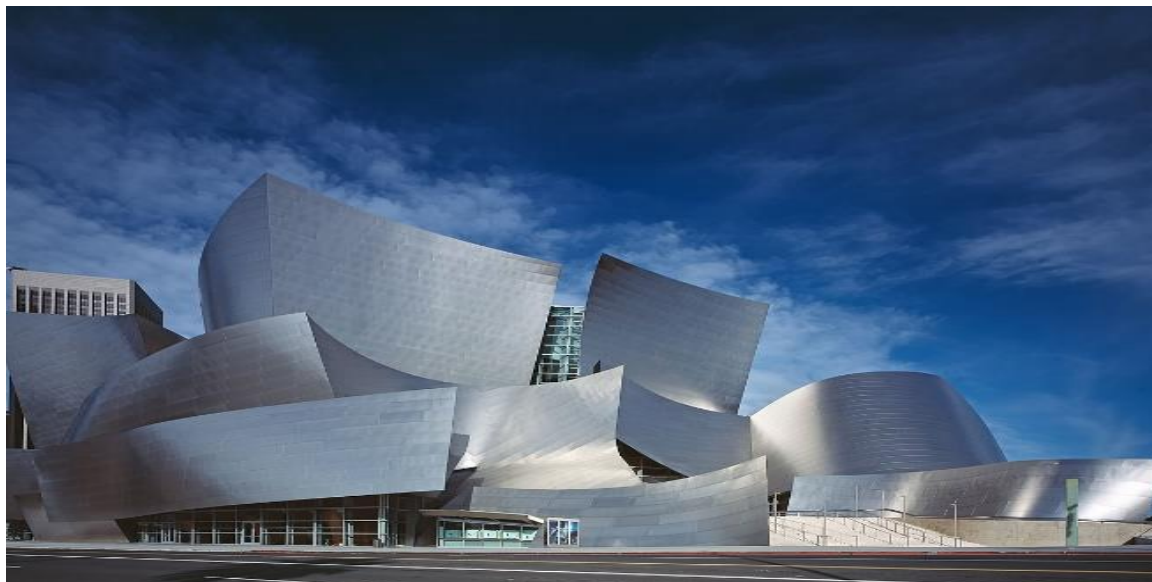
Рисунок 6- Концертный зал имени Уолта Диснея, Лос- Анджелес, США, 2003г.