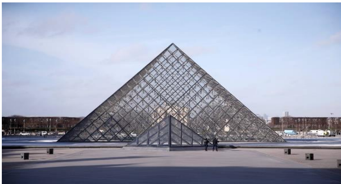
Рисунок 4- Большой Лувр, Париж, Франция, 1993 г.

Самая узнаваемая работа архитектора — стеклянная пирамида Лувра, которая широко подвергалась критике, а впоследствии стала символом Парижа. Для проекта взяты пропорции пирамиды Хеопса в Гизе.[6] Конструкция из стекла и стали высотой в 22 метра позволяет дневному свету свободно проникать в подземные помещения. Помимо пирамиды, служившей парадным входом в Лувр, Бэй Юймин спроектировал систему галерей, хранилища и переходы между зданиями в рамках проекта по масштабной реновации музея.