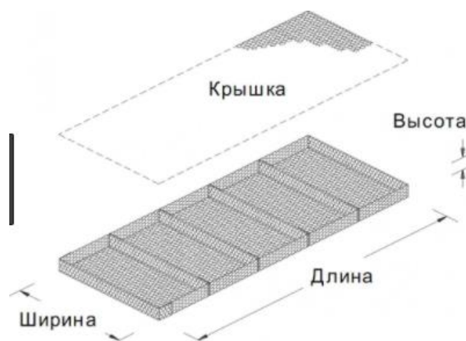
Рис. 2. Матрачно-тюфячные габрионы

2) Матрачно-тюфячные. Имеют небольшую высоту (до 50 см), в сравнении с остальными видами ГСИ. Габрион разделен при помощи установленных внутри диафрагм.