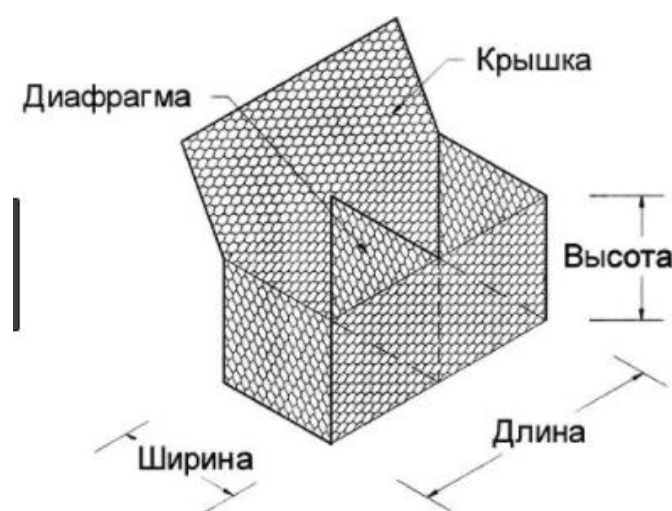
Рис. 1. Коробчатые габионы

1) Коробчатые. Используются для сооружения подпорных стенок, укрепления склонов, берегов.