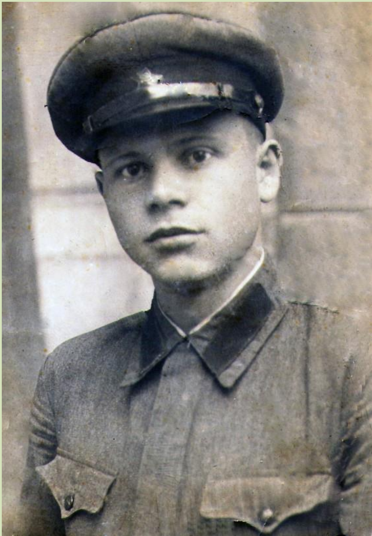
Фото Малюков Иван Григорьевич