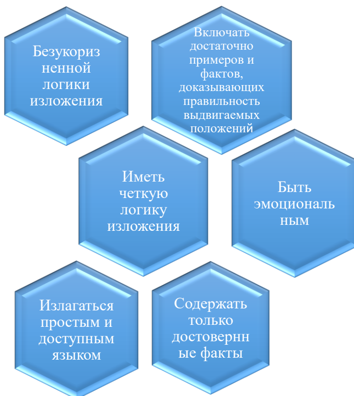
Рисунок 2. Требования к рассказу

Таким образом, рассказ – это устное изложение учебного материала. Этот метод широко применяется на всех этапах студенческого обучения. Со временем изменяется манера повествования, объем и сложность материала. [2] Требования к рассказу отображены на рисунке 2.