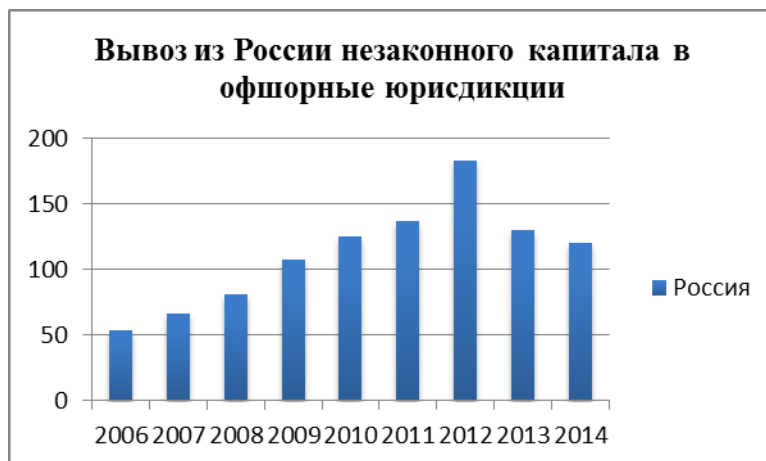
Рисунок 2. Вывоз из России незаконного капитала в офшорные юрисдикции в 2006-2014 г. млрд. долл. США

Из диаграммы становится очевидно, что в 2015 году инвестиции стали постепенно возвращаться на Кипр и в другие островные классические офшоры, которые пользуются наибольшей популярностью у российских бизнесменов. При этом Россия находится на 2 месте среди стран-лидеров в объёмах незаконного вывоза капитала в офшорные юрисдикции в 2006-2014 гг, что является неудивительным, так как согласно индексу восприятия коррупции, составленному организацией Transparency International Россия находится на 131 месте из 176 стран.