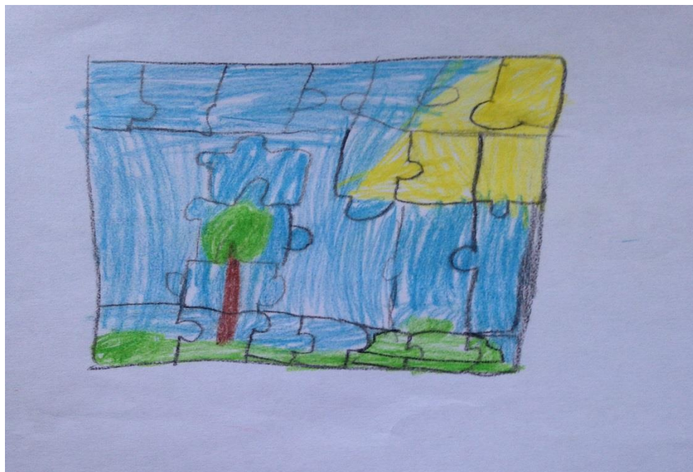
Рисунок 3. Образ «мы», девочка 8 лет