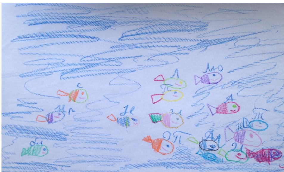
Рисунок 1. Образ «мы», мальчик 8 лет

Приведем несколько иллюстраций того, какой образ «мы» складывается у учащихся начальной школы в конце смены (рис. 1-4).