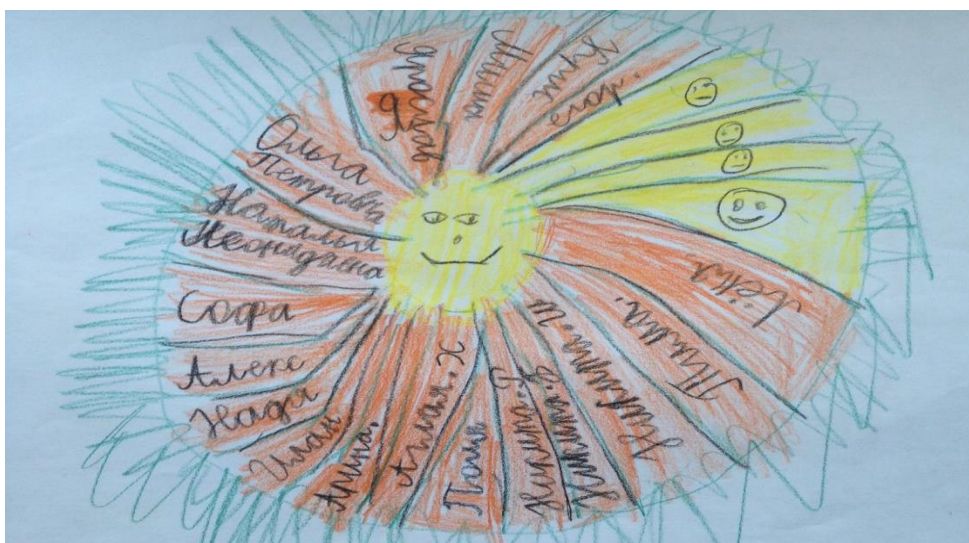
Рисунок 2. Образ «мы», мальчик 9 лет