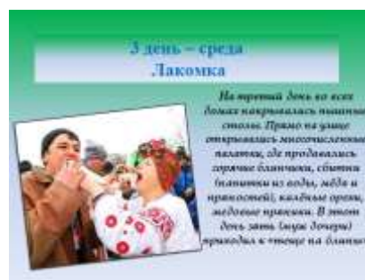
Слайд 8. Масленичная неделя. Название третьего дня.