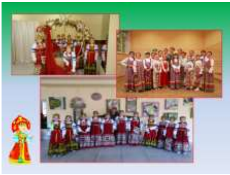
Слайд 23. Фотографии фольклорного ансамбля «Соловушка»