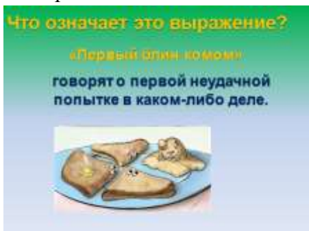
Слайд 19. Крылатое выражение «Первый блин комом».