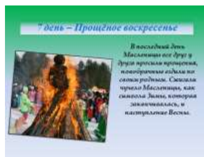
Слайд 12. Масленичная неделя. Название седьмого дня.