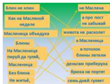
Слайд 18. Пословицы о масленице.