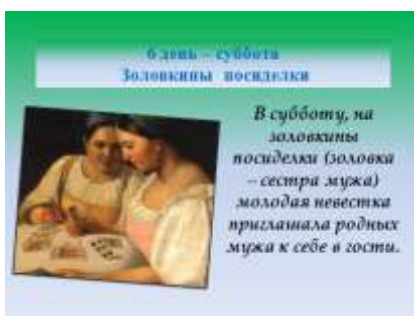
Слайд 11. Масленичная неделя. Название шестого дня.