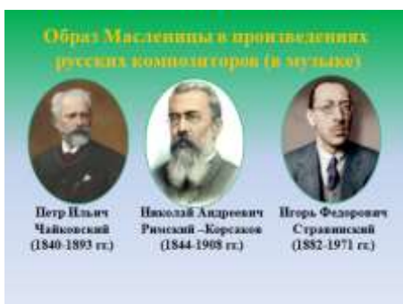
Слайд 17. Портеты русских композиторов слева направо П. Чайковский, Н. Римский-Корсаков И. Стравинский.