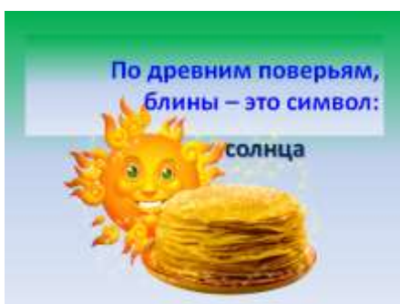
Слайд 5. Символ масленицы - блины.