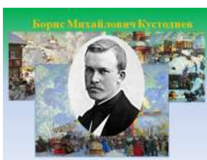
Слайд 14. Русский художник Б.М. Кустодиев и его картины на тему масленица.