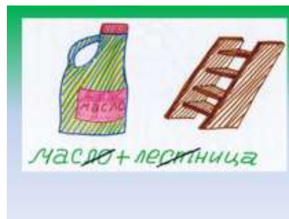
Слайд 2. Ребус с названием русского народного праздника «Масленица».