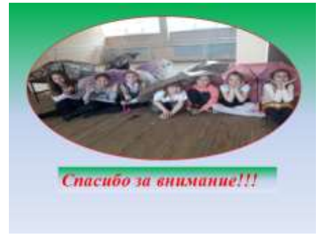
Слайд 24. «Спасибо за внимание!!!»