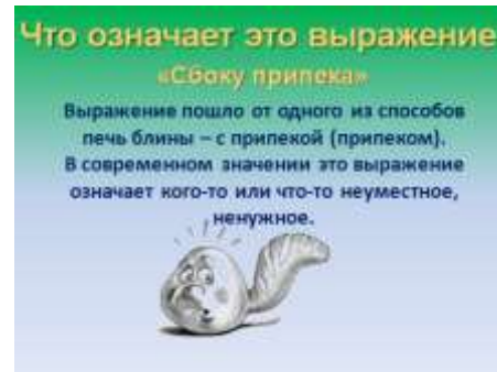
Слайд 22. Крылатое выражение «Сбоку припека».