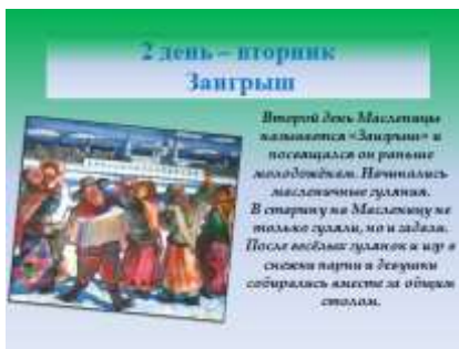
Слайд 7. Масленичная неделя. Название второго дня.