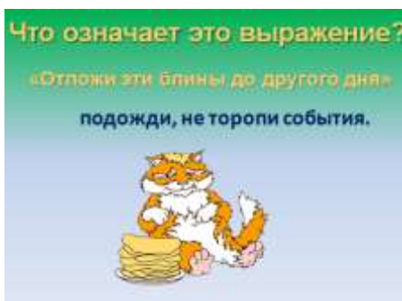
Слайд 21. Крылатое выражение «Отложи эти блины до другого дня».