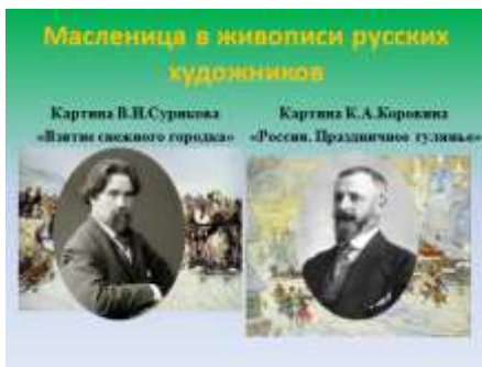
Слайд 15. Масленица в живописи Русских художников В. Суриков, К. Коровин.