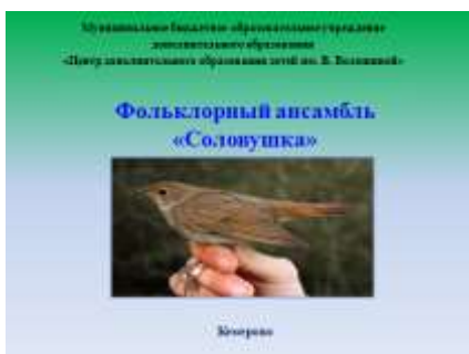
Слайд 1. Фоновая заставка. Название учреждения и объединения.