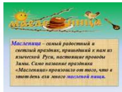
Слайд 4. Толкование праздника Масленица