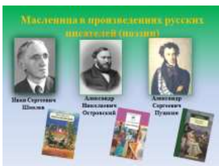
Слайд 13. Портреты писателей И. С. Шмелев, А.Н. Островский, А.С. Пушкин.