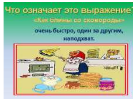
Слайд 20. Крылатое выражение «Как блины со сковороды».