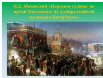
Слайд 16. Картина К.Е. Маковский «Народное гулянье во время Масленицы».