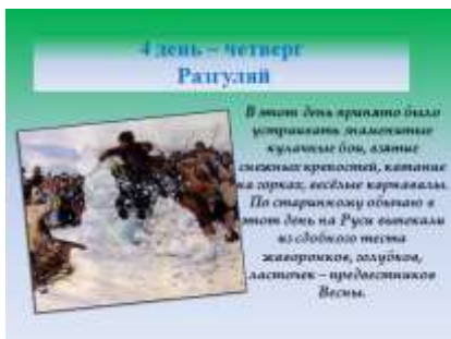
Слайд 9. Масленичная неделя. Название четвертого дня.