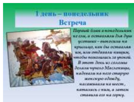
Слайд 6. Масленичная неделя. Название первого дня.