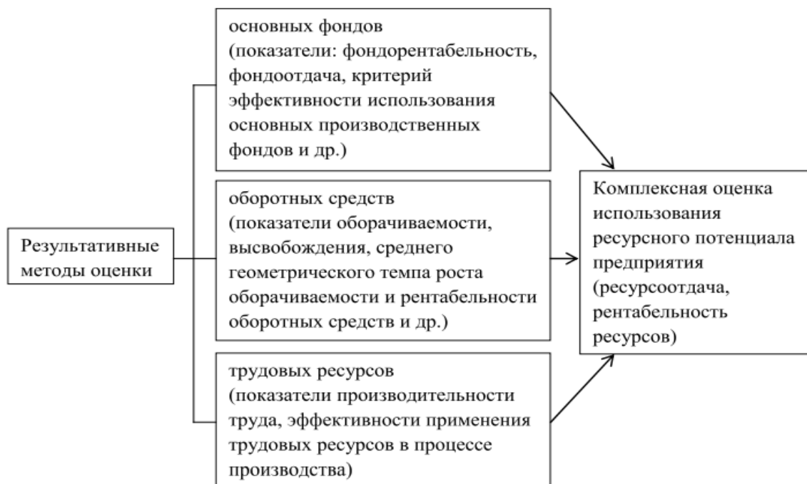
Рисунок 2 - Методика оценки эффективности использования ресурсного потенциала нефтегазового предприятия

Таким образом, на рисунке 2 представлена основная методика оценки эффективности использования ресурсного потенциала нефтегазового предприятия.