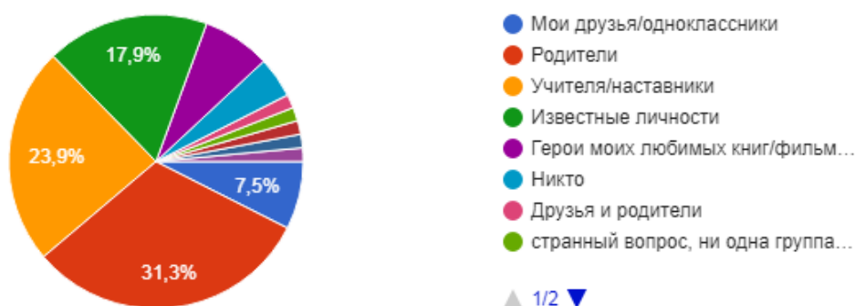
Рис. 2 Соотношение ответов на вопрос «Моё уважение вызывают...»

Данный вопрос подобно предыдущему иллюстрирует факт значимости родителя, причем уважение к родителям выступает на первый план у тех, кто имеет с ними доверительные отношения, а именно в большинстве своём люди, уже вышедшие из острого кризисного периода. Ведь как известно, одной из характерных черт кризиса подросткового периода является стремление к независимости и сомнение в родительском авторитете, что влечет за собой стремление к поиску авторитетной фигуры среди известных личностей, некоторых сверстников, а также героев книг, фильмов и видеоигр, которые в настоящее время всё больше набирают свою популярность и оказывают влияние на формирование личности подростка.