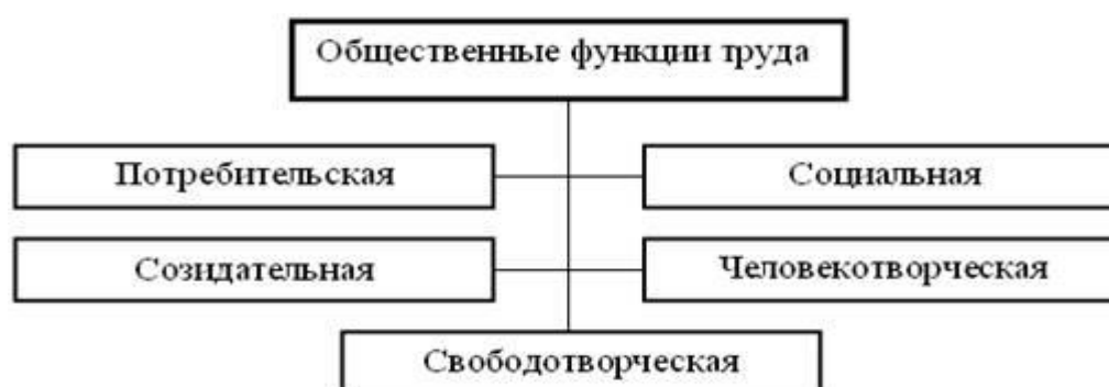
Рис.2. Функции труда

Роль труда проявляется в выполняемых им функциях. Выделим основные из всего их разнообразия (рис.2).