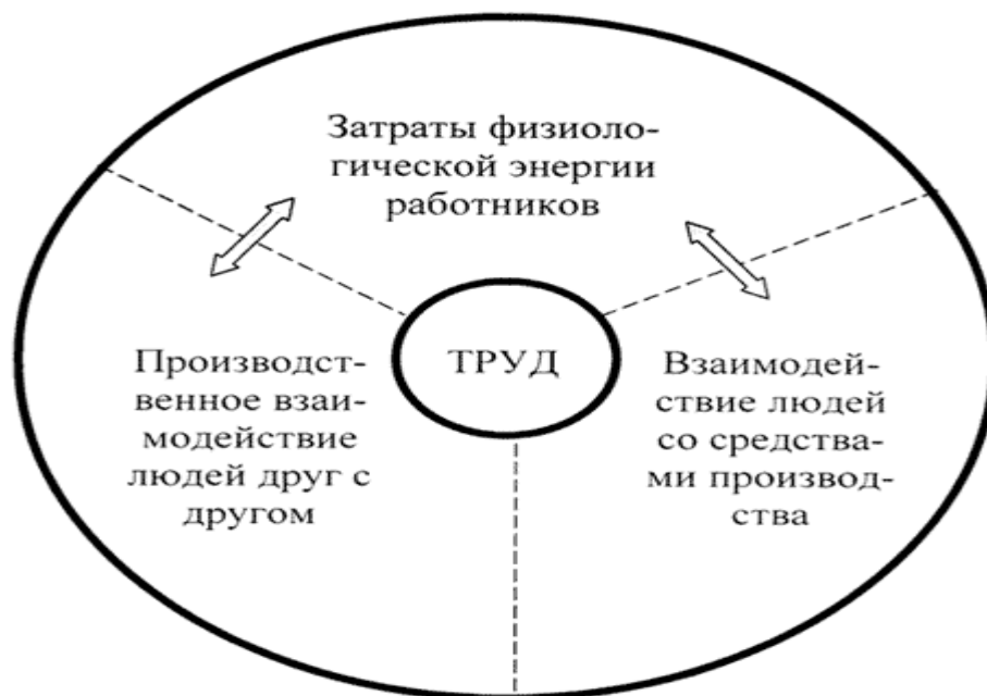
Рис. 2. Проявление и структура трудового процесса

Формы проявления труда отражают его структуру как совокупность процессов, происходящих во время труда. Эта структура представлена на рис. 3.