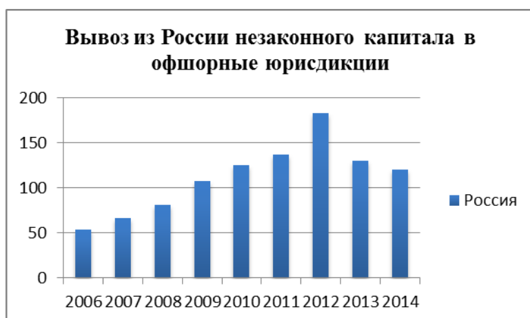
Рисунок 2. Вывоз из России незаконного капитала в офшорные юрисдикции в 2006-2014 г. млрд. долл. США

Из диаграммы становится очевидно, что в 2015 году инвестиции стали постепенно возвращаться на Кипр и в другие островные классические офшоры, которые пользуются наибольшей популярностью у российских бизнесменов. При этом Россия находится на 2 месте среди стран-лидеров в объёмах незаконного вывоза капитала в офшорные юрисдикции в 2006-2014 гг, что является неудивительным, так как согласно индексу восприятия коррупции, составленному организацией Transparency International Россия находится на 131 месте из 176 стран.