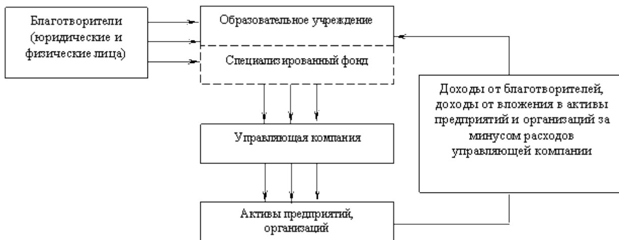
Рисунок 1 – Схема организации работы эндаумента в случае, когда собственником денежных средств выступает образовательное учреждение.

В одном случае при организации эндаумента собственником и бенефициаром доходов от эндаумента является одно образовательное учреждение. При данном варианте организации работы эндаумента в соответствии с действующим законодательством расходы, финансируемые за счет доходов эндаумента, подлежат обособленному бухгалтерскому учету.