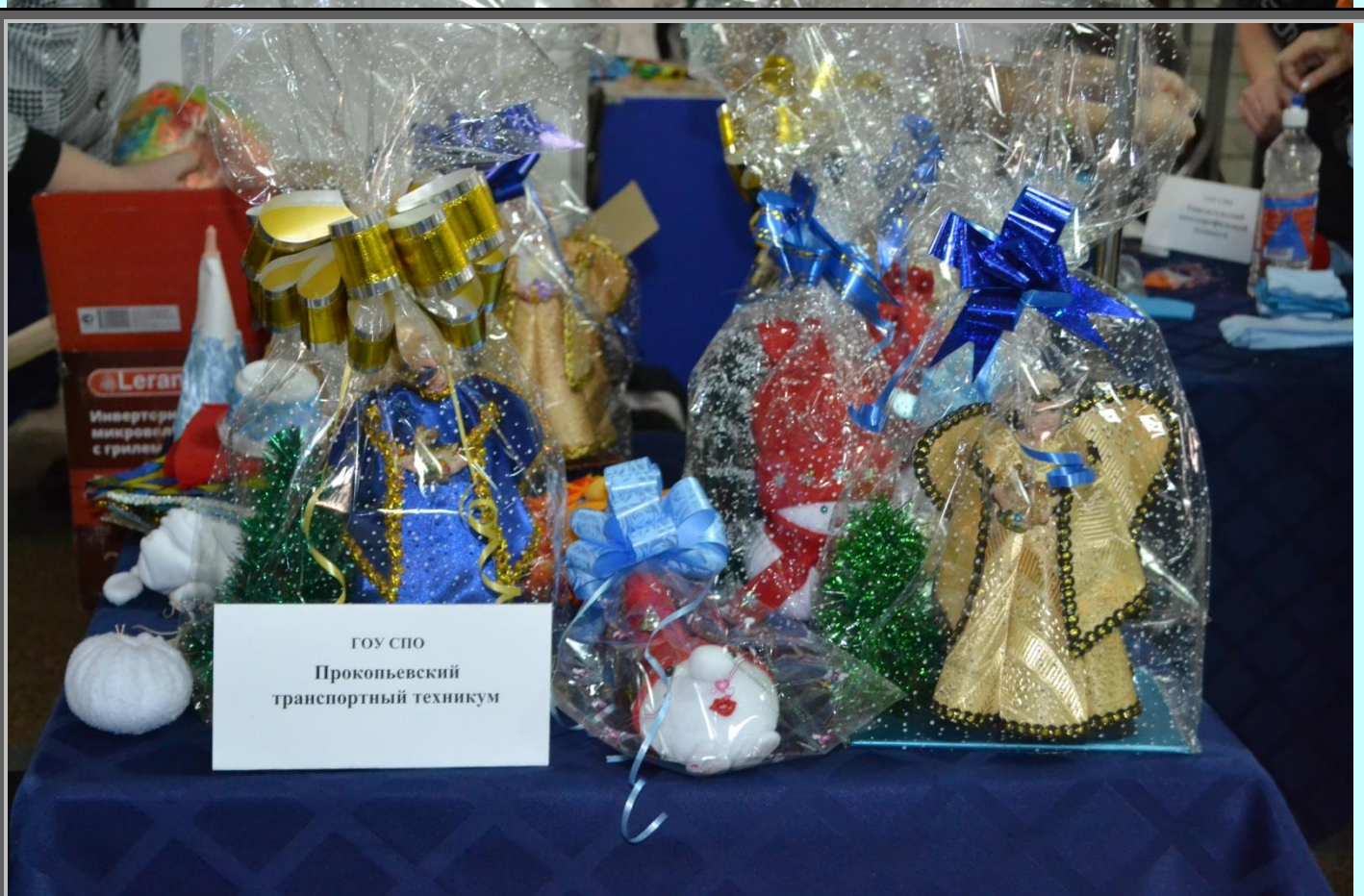
Ангелов рождественских в подарочках.