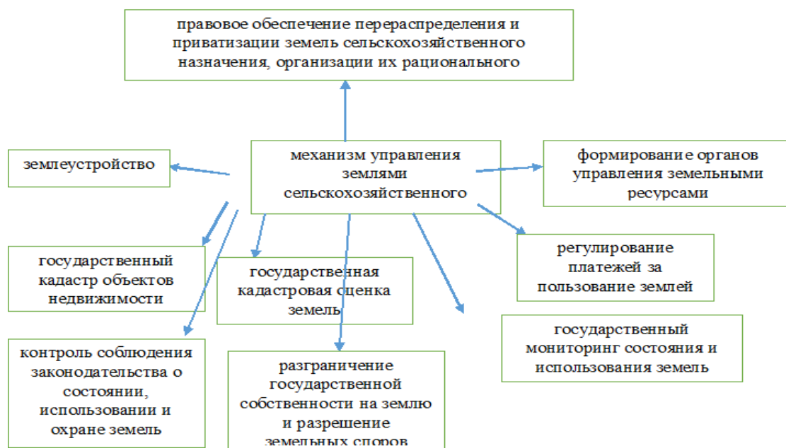
Рисунок 1 – Механизм управления землями сельскохозяйственного назначения на современном этапе

На наш взгляд, механизм управления землями сельскохозяйственного назначения на современном этапе должен включать (рисунок 1):