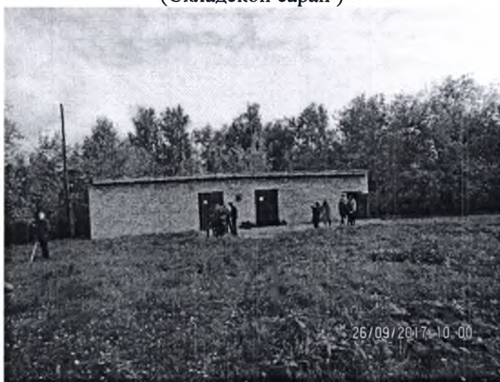
Фото № 4 (Территория ЗУ с КН 74:41:0101020:7)