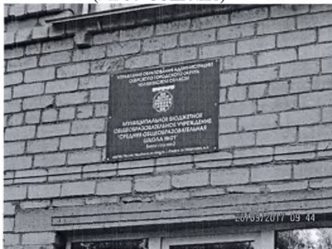
Фото № 2 (Центральный вход здания МБОУ СОШ № 21)