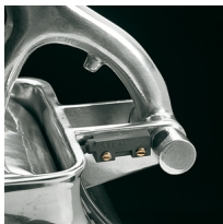
Microswitch on the grater