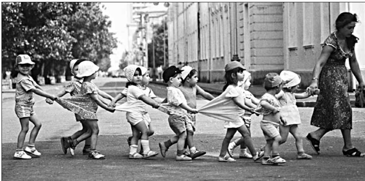
СССР: детсад на прогулке