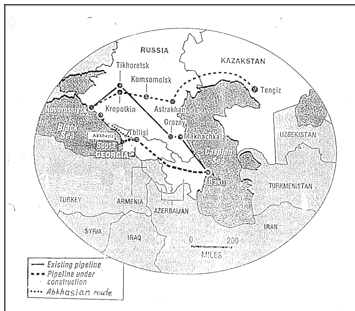
Рис. 1. Абхазский вариант строительства нефтепроводного маршрута Баку-Супса, предложенный западными компаниями в феврале 1998 г.

Указанные обращения абхазских политиков и активистов, адресованные иностранным компаниям, участвующим в каспийском нефтяном бизнесе и закавказских трубопроводных проектах, можно оценивать как элемент информационной политики Сухума для оказания давления как на официальный Тбилиси, так и на зарубежных инвесторов. Однако абхазская сторона не ограничилась обращением к международным бизнес-структурам. Частью информационной политики заграничных абхазских кругов стали аналогичные обращения в адрес международных организаций. В частности, «Миссия Абхазии» 20 января 1998 г. направила возмущенное письмо на имя тогдашнего постпреда США при ООН Билла Ричардсона. В письме выдвигались обвинения в адрес Соединенных Штатов за присуждение премии Центра Мира и Свободы им. Никсона тогдашнему президенту Грузии Э. Шеварднадзе. Обвинения также выдвигались в адрес Израиля за награждение Э. Шеварднадзе премией Института Демократии в Иерусалиме. Письмо заканчивалось абхазской оценкой Шеварднадзе: «Этот человек не дал мира ни Грузии, ни ее соседям».