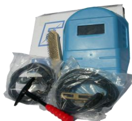
Оptionальный набор аксессуаров сварщика