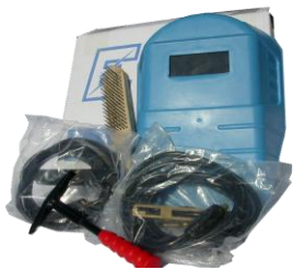
Оptionальный набор аксессуаров сварщика