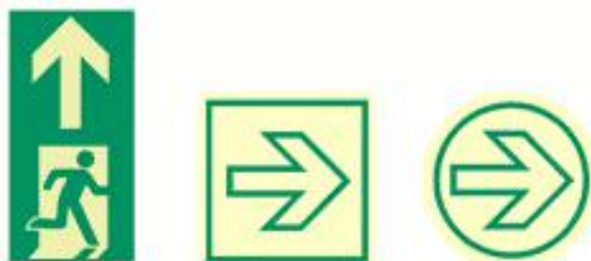
Рисунок 3 - Примеры указателей напольной разметки

Пункт 6.6.3. Второй абзац после слов "о направлении" изложить в новой редакции: