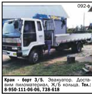
Кран - борт 3/5. Эвакуатор. Доставка пиломатериала, Ж/Б кольца. Тел.: 8-950-111-06-06, 738-618

Гравий, песок, отсев, щебень, опилки, ПГС, глину, дрова, уголь, обзол, продаю. Доставка. Самосвалы 1, 6, 10 тонн. Вывоз мусора. Грузчики. Тел.: 671-618