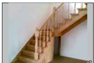
Изготовление и монтаж деревянных лестниц. Сроки 1-2 дня. Большой опыт работы. Бесплатный замер. Низкие цены. Тел.: 8-950-10-10-440

Низкие цены! Строительство домов, бань, пристроев. Сантехника, сварочные работы. Обширный вид услуг. Русская бригада. Пенсионерам скидки. Тел.: 8-902-7-646-755