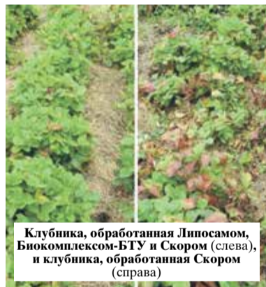
Клубника, обработанная Липосамом, Биоккомплексом-БТУ и Скором (слева), и клубника, обработанная Скором (справа)

В баковую смесь в это время неплохо добавить микробиологическое удобрение и фунгицид Биоккомплекс-БТУ для профилактики пятнистостей и серой гнили, а также стимуляции плодоношения и общего укрепления растений.