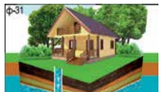
Бурение скважин. Надежно, качественно, недорого. Свыше 15м. насос в подарок. Консультация и выезд специалиста бесплатно. Пенсионерам скидка. тел. 8 (3952) 626-145

Бурение скважин на воду. Недорого. Тел.: 8-901-667-12-44, 8-950-085-87-86