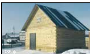
Готовые дома 36 кв. м в селе Урик от 550 тысяч рублей, продаю. 5 соток земли, вся инфраструктура. Возможно под материнский капитал. Проводим электричество. Помощь в оформлении. Тел.: 95-19-33, 95-19-22

Строительство срубов домов, бань (до 3 этажей). Беседки, лестницы, крыльцо, мансарды, веранды. Отделка внутренняя и наружная (вагонка, сайдинг). Бетонные, сварочные работы. Опыт более 15 лет. Качество гарантируем. Тел.: 8-914-926-03-61, 8-908-647-89-41, 960-361