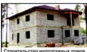
Строительство малоэтажных домов, бань, беседок из любого материала (кирпич, газобетон, брус). Фундамент. Крыша любой сложности. Отделочные работы. Качественно. Быстро. Недорого. Тел.: 8-950-058-31-79, 8-964-753-15-32

Строительство домов, бань, гаражей из любого материала. Полный цикл строительства под ключ, так же отдельно все виды работ. Официальный договор. Гарантия. Тел.: 8-964-22-26-077