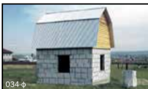
Готовые дома 36 кв. м в селе Урик от 550 тысяч рублей, продаю. 5 соток земли, вся инфраструктура. Возможно под материнский капитал. Проводим электричество. Помощь в оформлении. Тел.: 95-19-33, 95-19-22

Строительство срубов домов, бань (до 3 этажей). Беседки, лестницы, крыльцо, мансарды, веранды. Отделка внутренняя и наружная (вагонка, сайдинг). Бетонные, сварочные работы. Опыт более 15 лет. Качество гарантируем. Тел.: 8-914-926-03-61, 8-908-647-89-41, 960-361