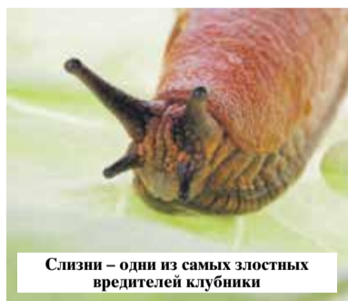
Слизни – один из самых зловредных вредителей клубники

Если, наоборот, погода сырая и пасмурная, клубнику могут атаковать слизни. Регулярно осматривайте грядку. Если заметите на ней вредителей, соорудите простейшие приманки (доски, куски линолеума и другие предмет), под которыми слизням будет удобно прятаться днем. В дальнейшем регулярно их проверяйте и уничтожайте собравшихся под ними моллюсков.