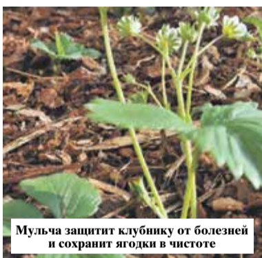
Мульча защитит клубнику от болезней и сохранит ягоды в чистоте

Особое внимание стоит уделить регулярной прополке и рыхлению земляники. Если грядки изначально не мульчировались, то в июне еще не поздно подложить под растения укрывные материалы, которые защитят ягоды от соприкосновения с почвой, загрязнения и поражения серой гнилью.