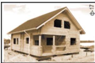
Строительство домов, бань из бруса. Русская бригада, выезд, замер, составление сметы бесплатно. Наличие своего качественного материала. Гарантия. Договор. Качество и соблюдение сроков. Тел.: 93-20-25