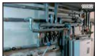
Сантехнические работы. Работаем со всеми видами материала, медь, железо, ППР, ПНД, пластик. Автономные системы, монтаж, ремонт, обслуживание. Т. 61-77-62, 738-132

Услуги электрика. Электромонтажные работы любой сложности. Качественно, профессионально, недорого. Договор. Гарантия до 25 лет. Тел.: 604-106