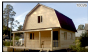
Сруб дома, бани 6 х 6 м, 8 х 8 м. Брус 16х18, балки, пол, потолок, дверные и оконные блоки (колоды), крыша простая или мансардная, стропила, обрешетка, фронтоны, карнизы, кровля межвенцовый утеплитель джут. Доставка. Сборка на вашем участке. Возможна оплата мат. капиталом. Возможен ремонт. Цена 7,8 т.р. м2. Тел. 693-145

Строительство домов, бань, гаражей. Бетонные работы. Фундамент. Наружная и внутренняя отделка. Русская бригада строителей. Многолетний опыт работы. Гарантия, качество. Тел.: 8-902-577-64-06, 8-904-154-82-94