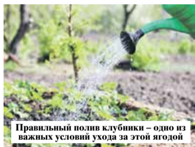
Правильный полив клубники – одно из важных условий ухода за этой ягодой

С самого начала плодоношения важно тщательно осматривать кустики клубники. Все подгнившие ягоды необходимо сразу собирать и уничтожать.