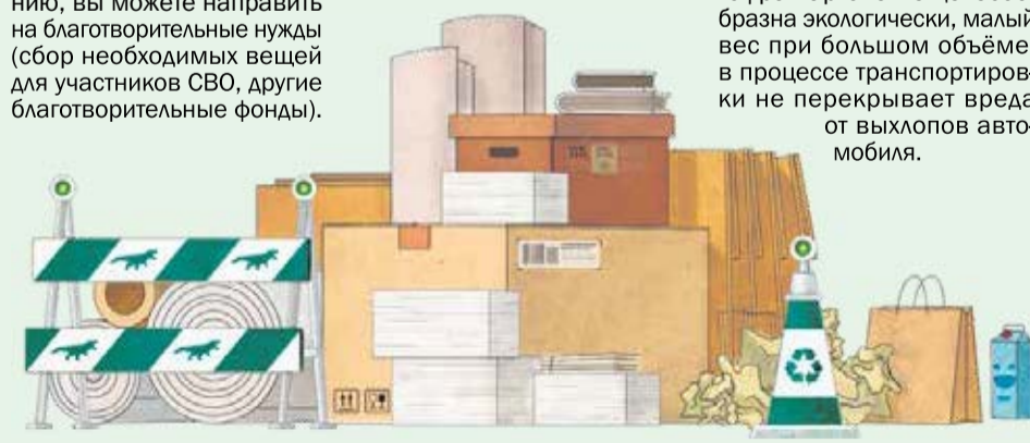
Пресс-служба администрации Иркутского района

С концертной программой выступили артисты народного вокального ансамбля «Зоренька» и ансамбль «КВиС» из культурно-спортивного центра Мамонского МО, народный фольклорный коллектив «Забава» и ансамбль «Маков цвет» из Большереченского МО, вокальный ансамбль «ЧАРОИТ» из культурно-спортивного комплекса Листвянского МО, ООО «Академия Караоке».