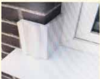
УТЕПЛЯЕМ ОКНА И УГЛЫ ПРОМЕРЗАНИЯ

Если вам холодно, то поспешите приобрести и отделать свой дом термопанелями, не дожидаясь весны. Зимние морозы вам будут не страшны!