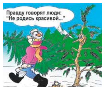
Правду говорят люди: "Не рожись красивой..."

— Давай, когда будет половина 12-ти закричим: Новый год! Новый год! Зачем это? — А пусть наши соседи думают, что к нам Новый год раньше пришел.