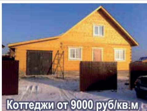
Коттеджи от 9000 руб/кв.м

ГОТОВЫЕ ДОМА с земельным участком по цене застройщика