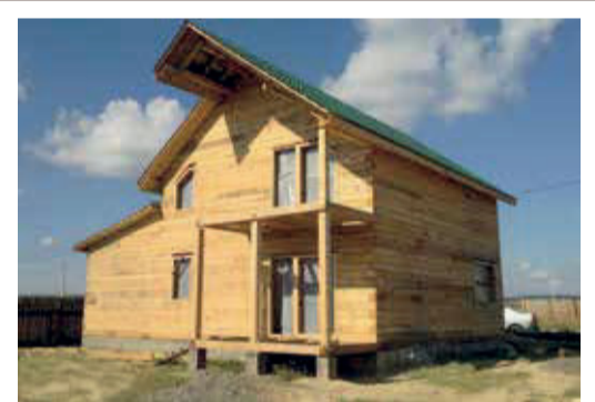
ДОМА ИЗ БРУСА