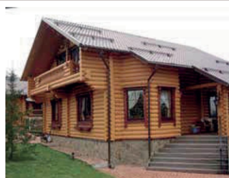
ДОМА ИЗ ОЦИЛИНДРОВАННОГО БРЕВНА