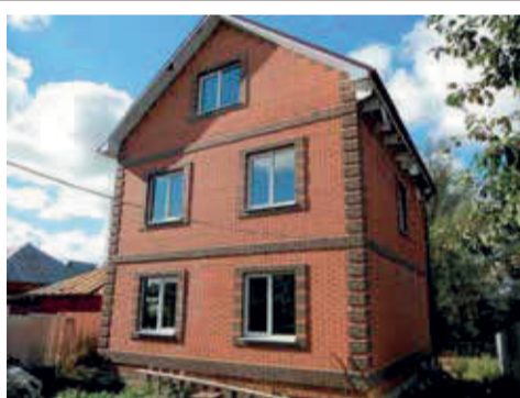
ДОМА ИЗ КИРПИЧА ИЗ ГАЗОБЕТОНА

ГОТОВЫЕ ДОМА с земельным участком по цене застройщика