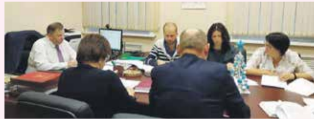
Пресс-служба администрации Иркутского района

Для того чтобы стать участником районной или областной подпрограммы, необходимо обратиться в отдел развития социальной сферы и молодежной политики администрации Иркутского района и получить консультацию о подпрограмме, ее механизмах, критериях для молодой семьи; обратиться в администрацию сельского или городского поселения по месту жительства для признания семьи нуждающейся в жилом помещении; подать заявление и необходимые документы для участия в одной из подпрограмм в отдел развития социальной сферы и молодежной политики администрации Иркутского района. Более подробную информацию можно получить по адресу: г. Иркутск, ул. Карла Маркса, д. 40, 2-й этаж, каб. № 7, тел.: 718-045, e-mail: irkromp@mail.ru.