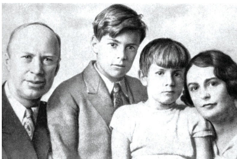
Он блондин, я — брюнетка