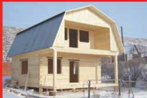
ДОМ ДАЧНЫЙ 6x6 с верандой 2x6 385 000 руб.