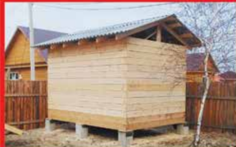
БАНЯ 3x4 125 000 руб.