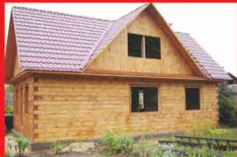
ДОМ ДАЧНЫЙ 6x10 545 000 руб.