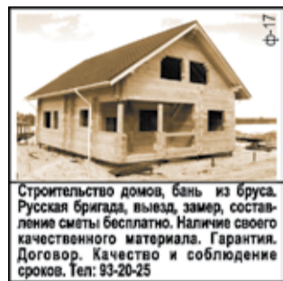
Строительство домов, бань из бруса. Русская бригада, выезд, замер, составление сметы бесплатно. Наличие своего качественного материала. Гарантия. Договор. Качество и соблюдение сроков. Тел: 93-20-25