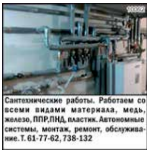
Сантехнические работы. Работаем со всеми видами материала, медь, железо, ППР, ПНД, пластик. Автономные системы, монтаж, ремонт, обслуживание. Т. 61-77-62, 738-132