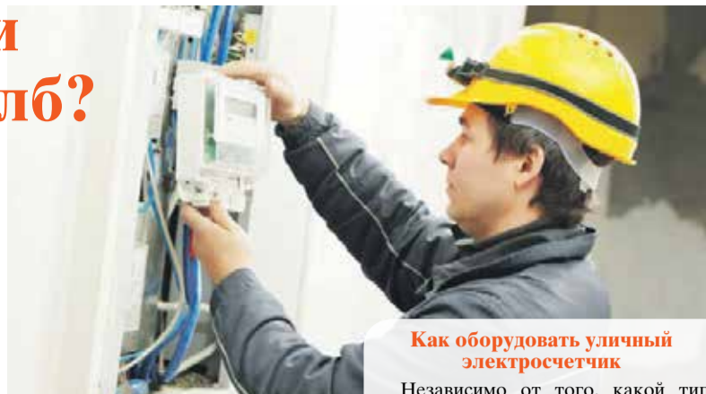
Как оборудовать уличный электросчетчик

Ответ на этот вопрос стал еще одним камнем преткновения в споре между домовладельцами и Энергосбытом. Дело в том, что все счетчики являются вашей собственностью, а значит, замена и перенос осуществля-