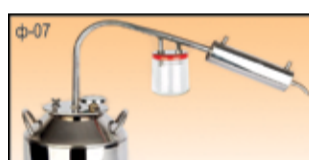
Дистилляторы от 2900 руб. комплектующие, аксессуары, спиртовые дрожжи, добавки и концентраты, спиртмеры, виномеры и др. товары. г.Иркутск, ул. Тракторная 35 ТЦ «Базар» пав.9, РТЦ «Фортуна», ТЦ «Твой Дом» пав.51, тел. 8-924-546-78-78