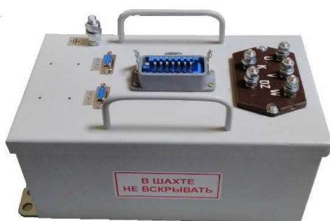
Рис. 43 Общий вид аппаратов АЗУР-1МК и АЗУР-1МКИ

На корпусе имеются кронштейны для крепления аппаратов в корпусе передвижных трансформаторных подстанций или коммутационных аппаратов.