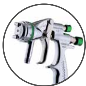
Walcom Genesi SP

Пневматические краскораспылители с принудительной подачей материала.