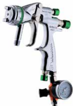
Walcom Genesi SP

Пневматические краскораспылители с принудительной подачей материала