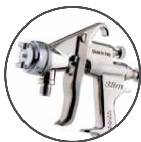
Walcom Slim SP