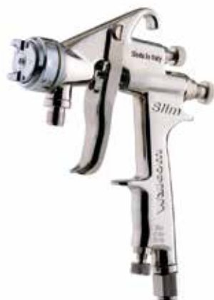
Walcom Slim SP