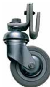
Комплект из 4-х колёс

К бачкам с верхней подачей – для быстрой замены цвета (типа) материала или промывки оборудования.